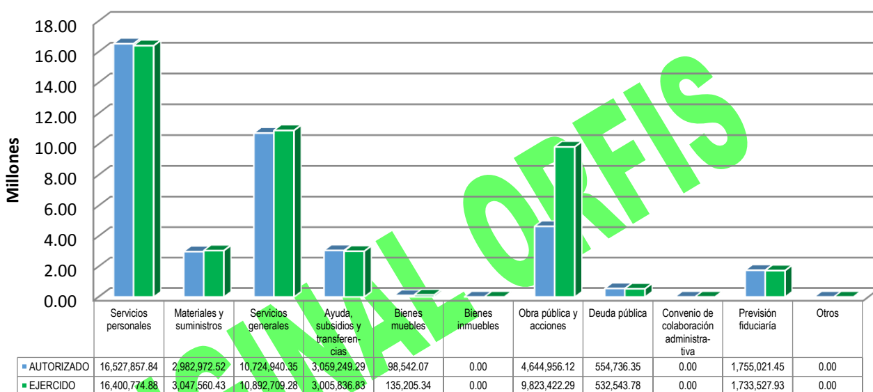
GRÁFICA 2 EGRESOS